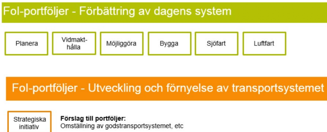
Figur 3 Trafikverkets Fol-portföljer (översikt från Trafikverkets dokument)

I Figur 3 redovisas Trafikverkets Fol-portföljer.