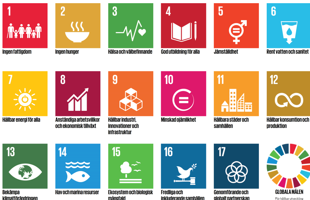
Figur 1 FNs Globala mål – illustration från hemsida ( www.globalamalen.se )