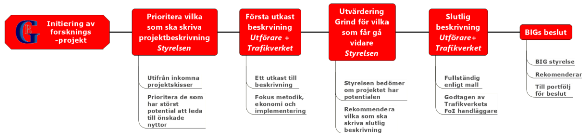
Figur 2 Process för framtagande av projektspecifikation