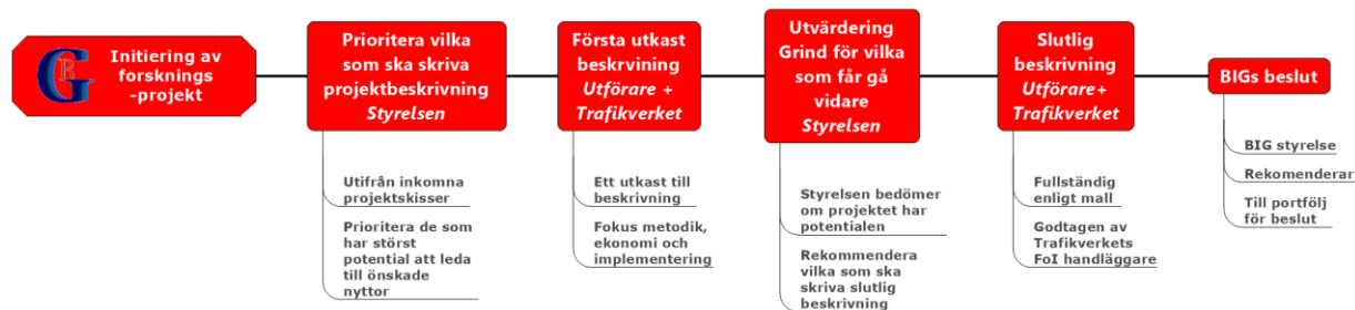
Figur 2 Process för framtagande av projektspecifikation